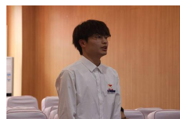
▲小组代表正在发言

青马人的力量，引导更多青年坚定信心，紧跟党走。同时作为青马工程学员，更要树立“年少多壮志，青春应许国”的信念，为祖国建设添砖加瓦。通过此次“两会精神”学习交流，不仅加强了学员们的思想教育，更加激励学员们以饱满的热情，为学校整体发展贡献智慧和力量。