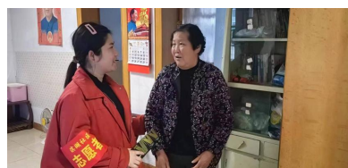
▲志愿者在解答居民的疑惑