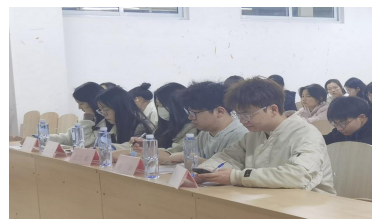
▲比赛进行时的照片

(经济与管理学部)翰墨飘香, 书写中华精髓; 字正腔圆, 吟诵华夏文明。为丰富校园文化生活, 进一步提升经管学部学生素养, 推动文化事业发展, 经济与管理学部于 2024 年 3 月 15 日下午七点半, 在 1A307 教室举办“三字一话”比赛。